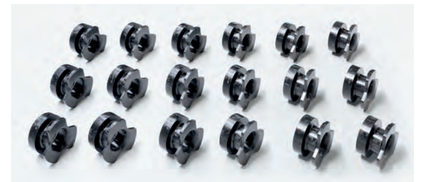
Große Stückzahlen, effizient in Serie gefertigt.

Die Umwandlung der Schwingungsenergie in innere Wärme bewirkt eine Reduzierung der Amplitude und ein beschleunigtes Abklingen induzierter Schwingungen.